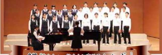
6組「あなたへ～旅立ちに寄せるメッセージ～」