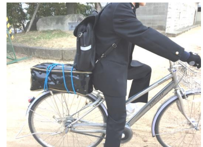
⑥背中に三木中バッグ+荷台にエナメルバッグ