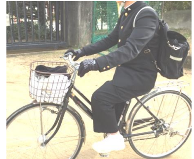
③三木中バッグを背負う