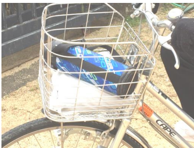
①前カゴには、水筒、雨合羽など

自転車での通学上の安全性を高めるため、ハンドルが操作しやすいように前カゴに重い荷物を入れない指導を行っています。軽い水筒や雨合羽、小さなバッグ等は構いませんが、多くの教科書が入った三木中バッグなどは、荷台に荷綱でくる（写真参照）か、背中にリュックの形で背負うようにしましょう。