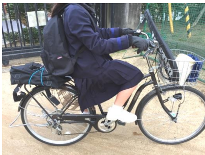
④荷台に三木中バッグ+リュックを背負う